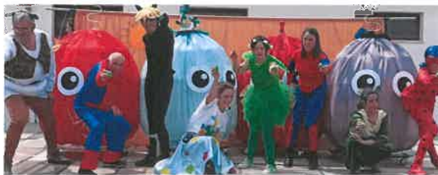
IMAGEM 1: GRUPO DE EXPRESSÃO DRAMÁTICA NO 45.º ANIVERSÁRIO DA CERCIMIRA (MAIO DE 2023)

As atividades de divulgação dos serviços prestados e atividades foi realizada essencialmente com recurso a publicações no site da Internet e nas redes sociais Facebook e Tweeter.